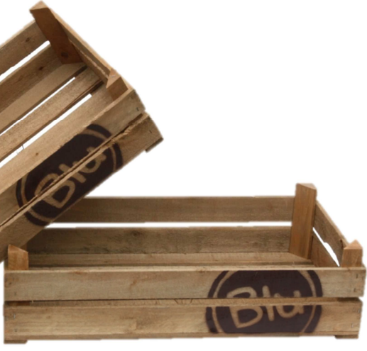
BLU-HOLZKISTEN MIT POSTER-SET