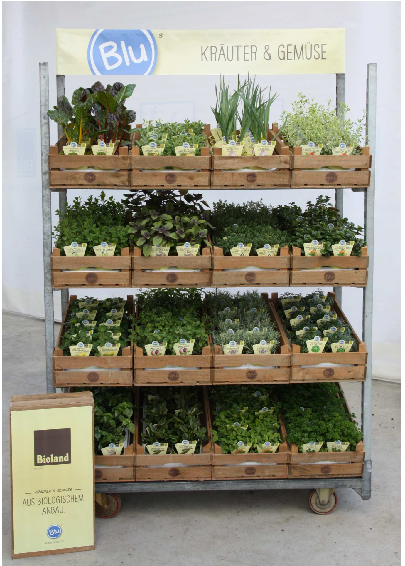
PRÄSENTATION MIT BLU-HOLZKISTEN AUF CC-CONTAINER MIT TISCHBANDEROLE