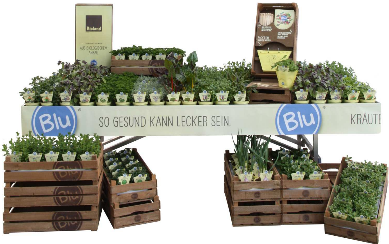
TISCHPRÄSENTATION MIT „VERSCHENK-MICH“-STATION