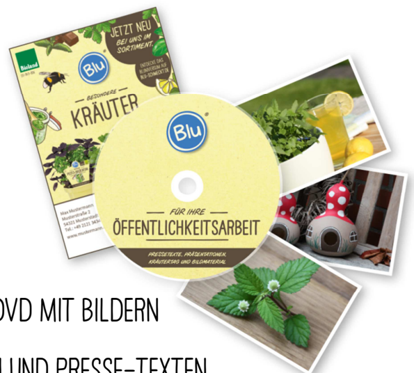
PRESSE-DVD MIT BILDERN