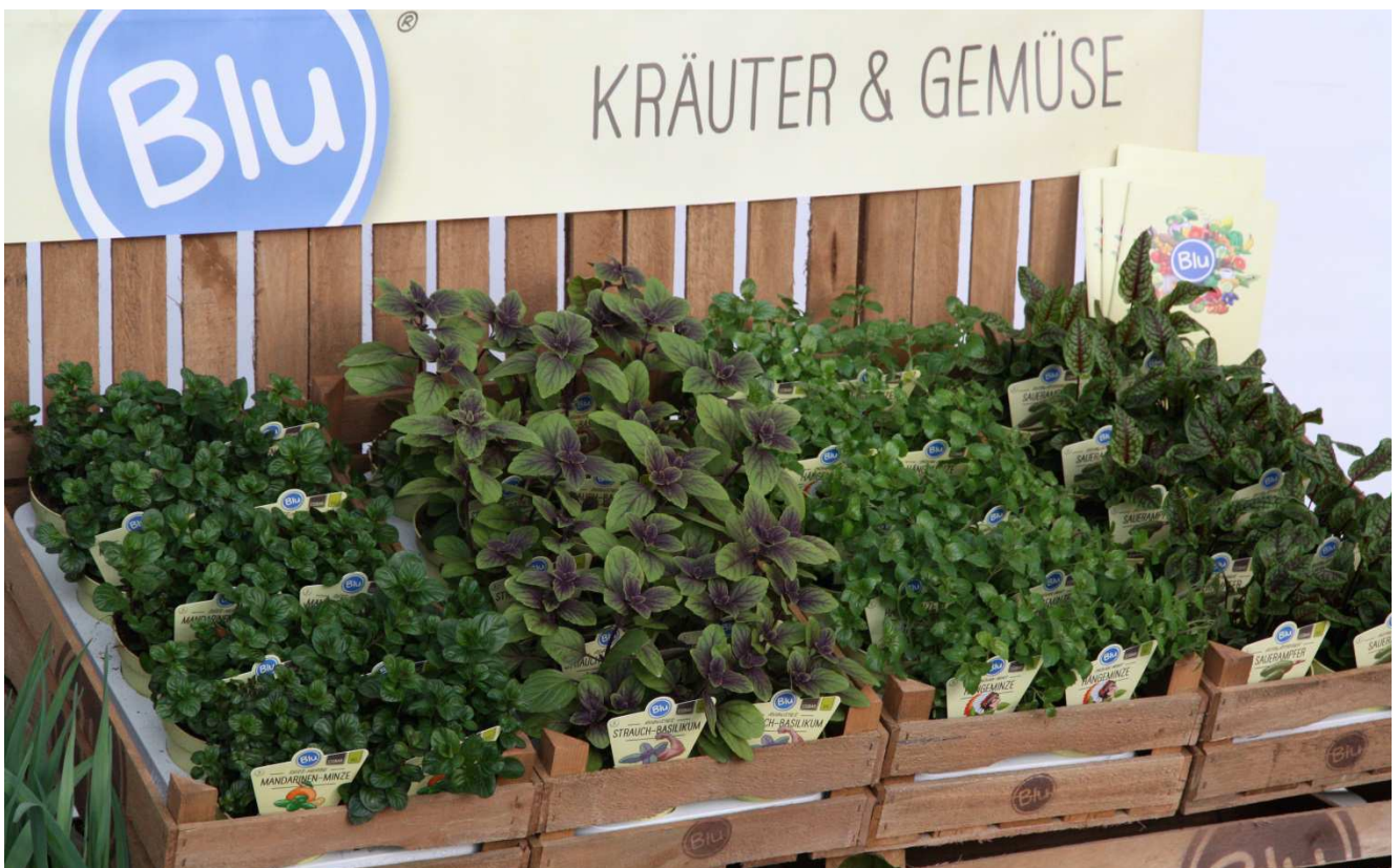
PRÄSENTATION MIT UND IN BLU-HOLZKISTEN