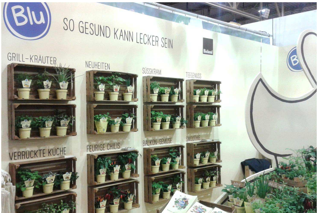
BLU-HOLZKISTEN AN DER WAND NACH THEMEN SORTIERT