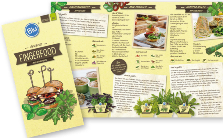
REZEPTFLYER „FINGERFOOD MIT KRÄUTERN“