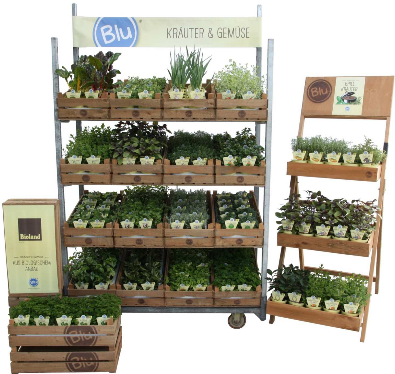
PRÄSENTATION MIT BLU-HOLZKISTEN AUF CC-CONTAINER UND BLU- HOLZREGAL